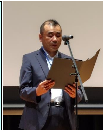
豊口整備局長 来賓挨拶

本会議を通じて防災やインフラメンテナンスへの意識を高め、それぞれの立場で何をすべきかを考え行動出来るよう願う。