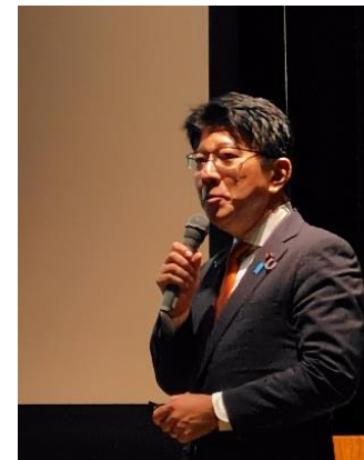
長谷川議員 基調講演

本会議を通じて防災やインフラメンテナンスへの意識を高め、それぞれの立場で何をすべきかを考え行動出来るよう願う。