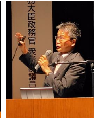
池口公企課課長 講演

豪雨災害の教訓を踏まえ、社会インフラ整備、事前復興、群マネの推進による南予地域の強靱化を推進。