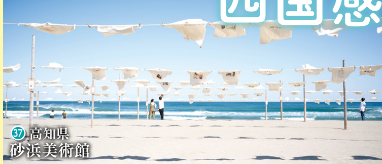
37 高知県 砂浜美術館