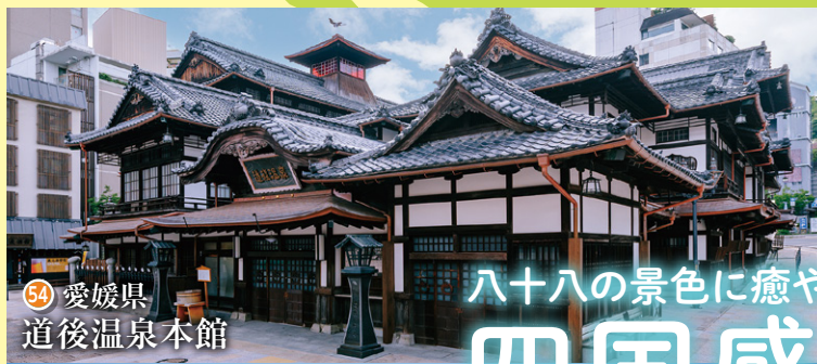
54 愛媛県 道後温泉本館