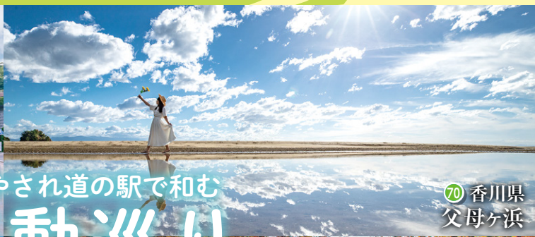
70 香川県 父母ヶ浜