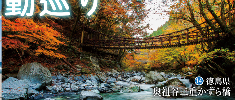
14 徳島県 奥祖谷二重かずら橋