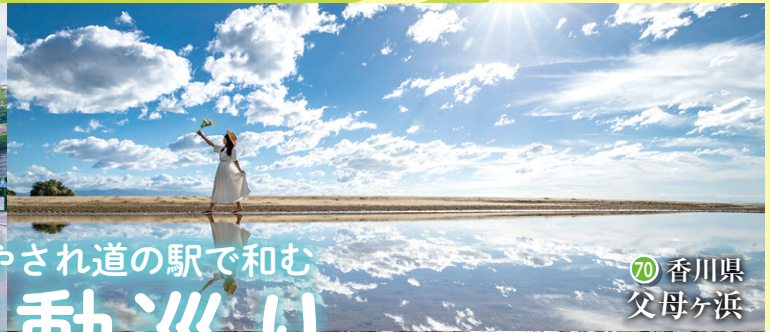
70 香川県 父母ヶ浜