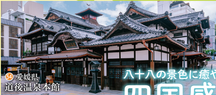
54 愛媛県 道後温泉本館