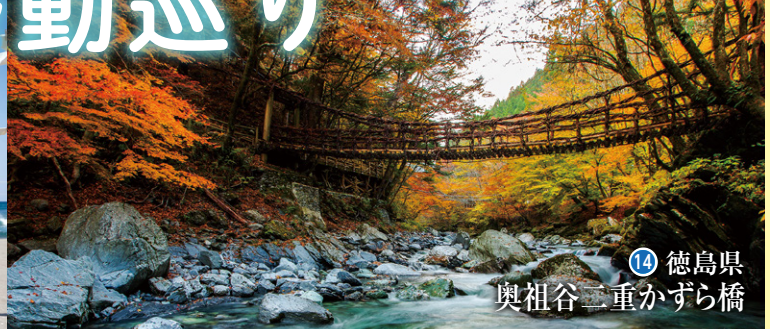
14 徳島県 奥祖谷二重かずら橋