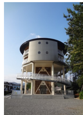
第1号津波避難タワー (外観)