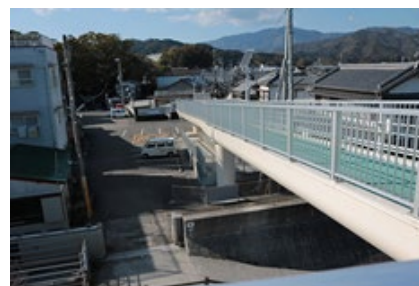
中土佐久礼地区中心部からの避難路