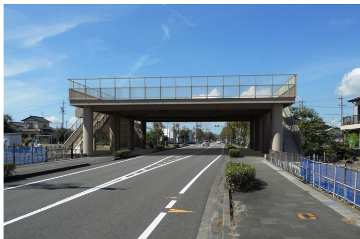
静岡県吉田町の津波避難タワー