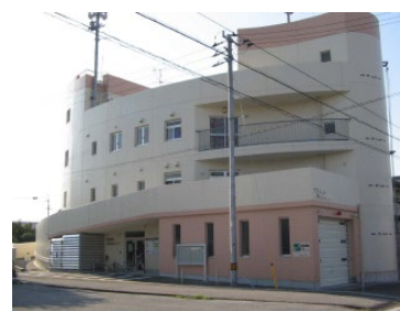
種崎地区津波避難センター