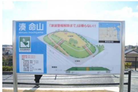
静岡県袋井市湊地内の命山