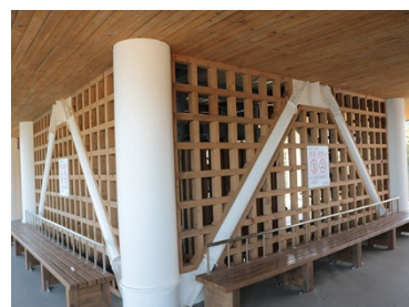
第1号津波避難タワー (内観)