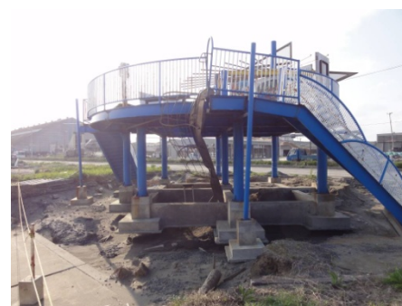
津波避難タワーの基礎部分が洗掘 （東日本大震災：石巻市）