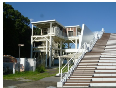
浜の宮地区津波避難タワー