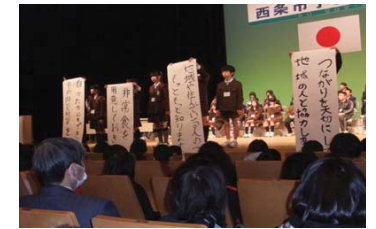
西条市子ども防災サミット