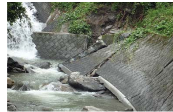
H23 災害（西条市 青木川）

今後は、さらにハード及びソフト対策に努め、来る大規模地震災害等に備えて行きたいと考えています。