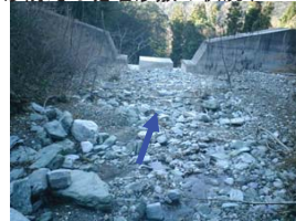
土石が堆積し、ほぼ満砂状態