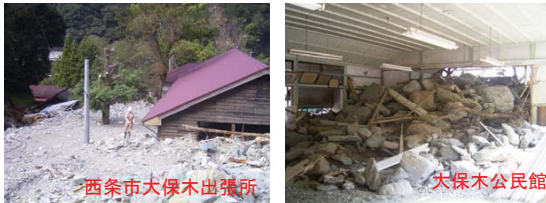
西条市大保木出張所