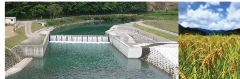
可動化された平串堰

今後は、仁井田川河川改修事業によって洪水被害を受ける心配が無くなった高南台地で安心して「仁井田米」の生産が続くと確信しています。