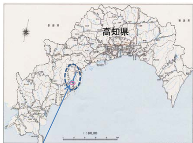
高知県高岡郡四万十町 仁井田川