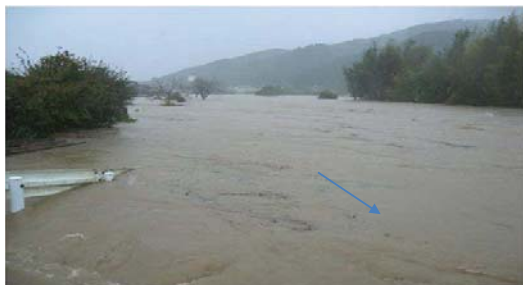
平成16年8月の台風10号による仁井田川の氾濫状況

仁井田川は、一級河川四万十川の一支であり、河川延長17.6Km、流域面積27.1km 2 、計画高水流量450m 3 /sであり、県内屈指の優良な農業地帯「高南台地」を大きく蛇行し、清流四万十川へ合流しています。当河川では、度々、浸水被害が発生しており、近年では、平成16年8月(台風10号)に、床上浸水17戸、床下浸水27戸のほか、国道56号の冠水や農地が浸水被害を被っています。度重なる浸水被害を軽減するため、昭和57年から事業に着手し、以来、継続的に河川改修工事を行っています。