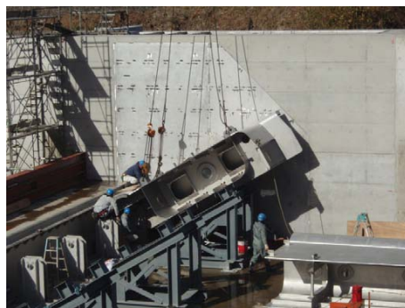
四国最大規模の鋼製起伏ゲートの組み立て状況