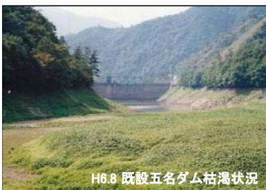
H6.8 既設五名ダム枯渇状況

また、東かがわ市の水源の一部を担う香川用水についても、毎年のように給水制限を繰り返していることから、安定した自己水源の確保が切望されています。