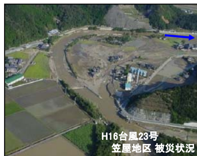
H16台風23号 笠屋地区 被災状況

湊川流域は急流のため古くからたびたび洪水による被害を受けており、昭和49年、51年、62年、平成16年と大雨による浸水を繰り返してきました。特に既往最大であった、平成16年の台風23号では、五名ダム上流を中心に最大時間雨量116mm、総雨量674mmと、いずれも県内最高の降雨を記録し、浸水面積161.8ha、床下浸水116戸、床上浸水44戸、全半壊4戸と、過去に例がないほどの大規模な浸水被害を受けております。また、ほぼ全川において土木施設被害を受けており、特に被害が甚大であった笠屋地区では河川等災害関連事業が採択され、これまでその復旧に努めてきました。