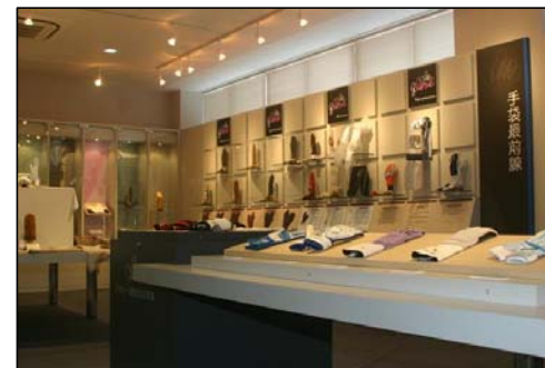
120年の歴史がある手袋産業

瀬戸内海に注ぐ馬宿川、小海川、湊川、与田川、番屋川などの流域に平野部が開け、市街地と田園地域を形成しています。比較的晴天の日が多く、降水量が少ない瀬戸内海特有の温暖で穏やかな気候です。