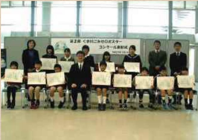
【熊本県】球磨川 次世代のためにがんばる会

河川協力団体は市民と河川管理者、双方の立場を理解し、活動しています。市民と河川管理者の間に立つことで、お互いの視点や想いを融合することが出来ます。その結果、河川の利活用や維持・管理につながります。