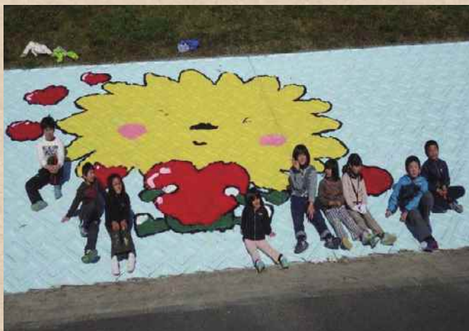
【徳島県】桑野川 横見町をきれいにする会

誰でも、いつでも気軽に近づく快適な河川空間は維持・管理が重要です。河川協力団体が実際の作業を行うにあたって、河川管理者と河川協力団体が協力して計画を作成するなど、両者が一体となって安心・安全な河川空間の維持・管理の質の向上につながっています。