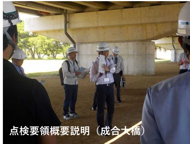
点検要領概要説明(成合大橋)

■行 程： 13:00 現地集合 13:05 点検要領改定概要説明 13:35 実橋説明 ①成合大橋 14:10 実橋説明 ②円座町14号線1号橋 14:25 実橋説明 ③香東大橋 15:40 意見交換会 16:40 閉会