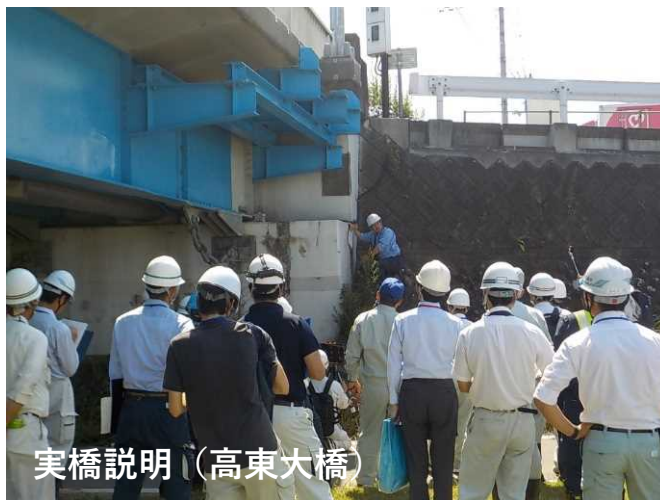
実橋説明(高東大橋)