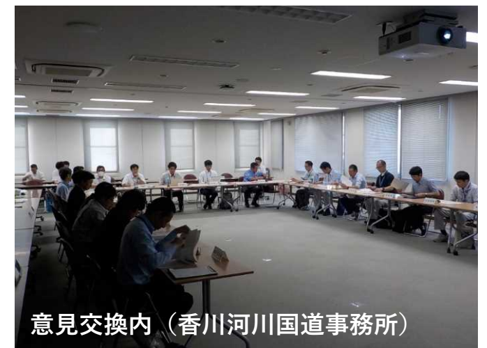
意見交換内(香川河川国道事務所)