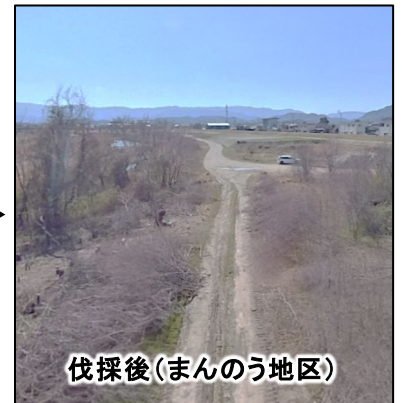
伐採後(まんのう地区)