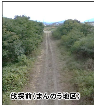
伐採前(まんのう地区)