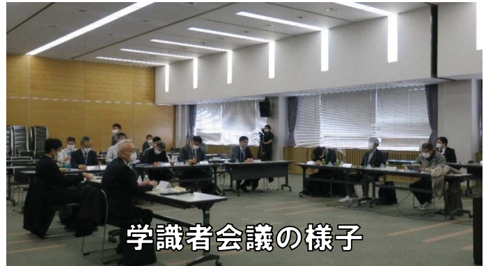
学識者会議の様子