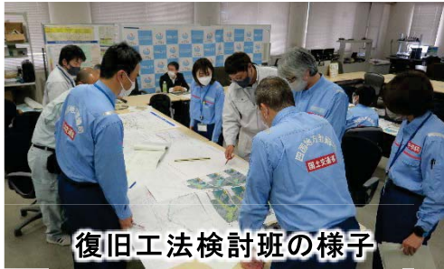
復旧工法検討班の様子

今回は台風による想定最大規模相当の洪水により堤防が決壊し、2週間後に予測される出水に対して、二次的な被害を最少にとどめられるよう「被害状況の監視・共有」と「緊急復旧工法の復旧」を段階的に検討しました。