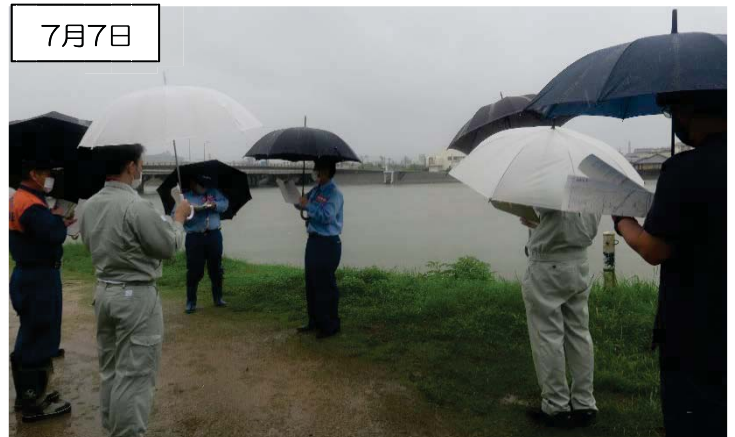
重要水防箇所の巡視 (右岸0k600付近: 堤体漏水)