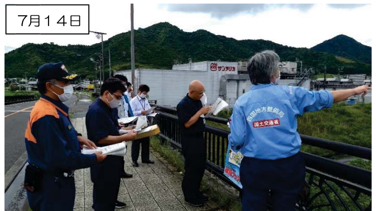
重要水防箇所の巡視 (15k付近: 河床低下)