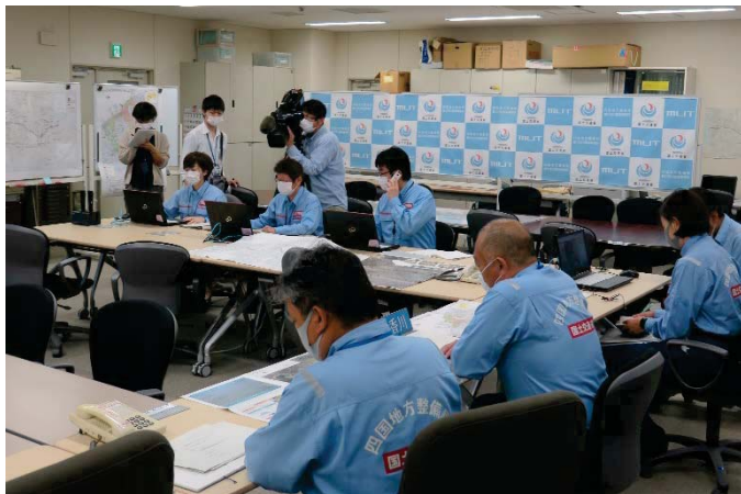
被災状況の確認と情報共有

県内初めての緊急速報メール配信訓練(洪水情報)で、訓練の様子はNHKのテレビニュースで紹介していただきました。訓練では、緊急速報メール配信の対象地域にお住まいにも関わらず受信できなかった方や、対象地域外にお住まいの方が受信していたという事例が数件寄せられており、課題がいくつか浮き彫りになりました。リバーキーパーズの皆様につきましても、お気づきの点がございましたら下記の窓口までお問い合わせください。