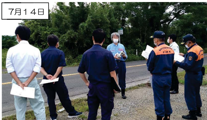
重要水防箇所の巡視 (右岸13k800付近: 越水・溢水)