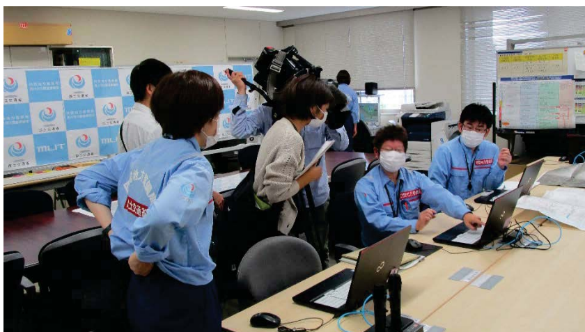
緊急速報メール作成の説明