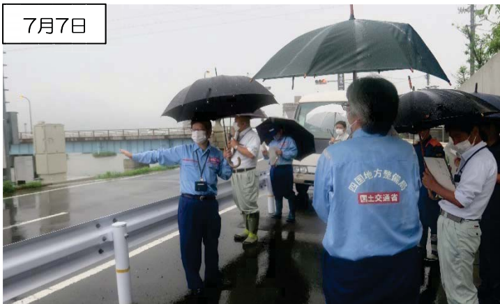
重要水防箇所の巡視 (左岸1k600付近: 越水・溢水)