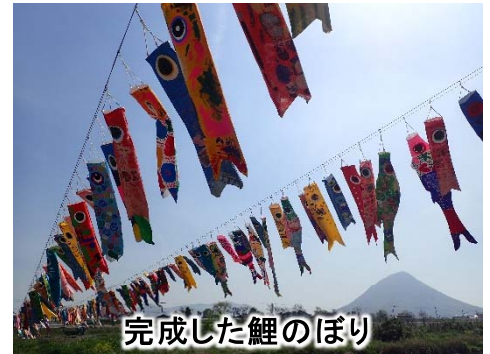
完成した鯉のぼり