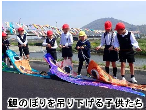
鯉のぼりを吊り下げる子供たち