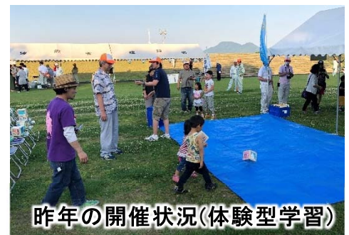
昨年の開催状況(体験型学習)