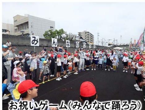
お祝いゲーム(みんなで踊ろう)