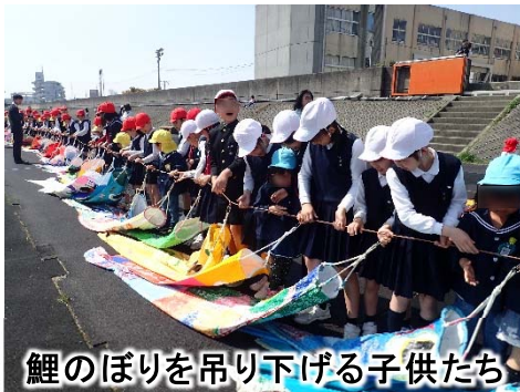
鯉のぼりを吊り下げる子供たち

4月18日(木)、土器川の河川敷「みんなの広場」において、「鯉のぼり吊り渡し」が開催され、近隣の城東小学校と城東幼稚園、青ノ山、土居両保育所の子供たちが手作りした約300匹の鯉のぼりを、土器川に渡らせました。この日は城東小4年生と城東幼稚園の5歳児約150人が参加し、国土交通省職員や丸亀市職員らと一緒に、ワイヤー2本に鯉のぼりをつり下げ、土器川を爽やかに泳ぐ鯉のぼりを見事に完成させました。