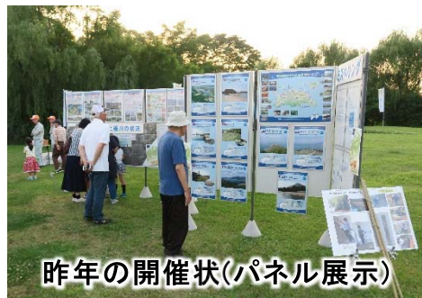
昨年の開催状(パネル展示)