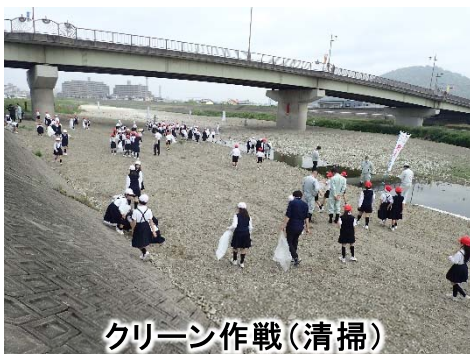
クリーン作戦(清掃)

河原の清掃やフナの稚魚約1,000匹の放流を行い、豊かな自然と戯れながら地域を潤す土器川の大切さを学んでもらい、土器川への関心を深めてもらいました。