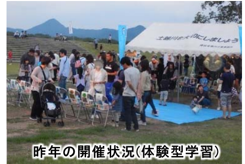
昨年の開催状況(体験型学習)