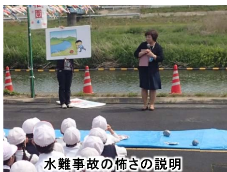
水難事故の怖さの説明