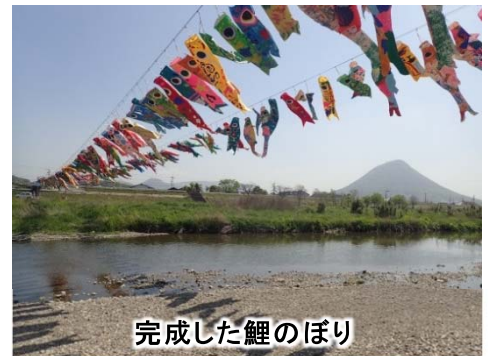
完成した鯉のぼり