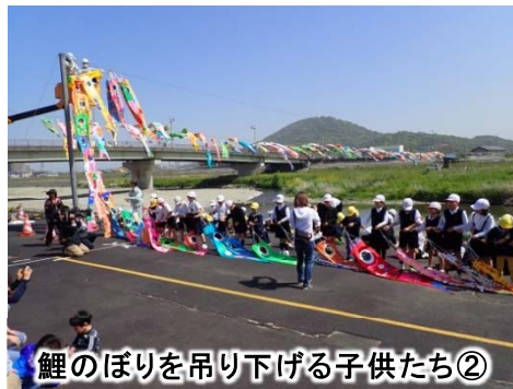
鯉のぼりを吊り下げる子供たち②