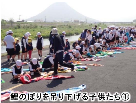
鯉のぼりを吊り下げる子供たち①

4月18日(水)、土器川の河川敷「みんなの広場」において、「鯉のぼり吊り渡し」が開催され、近隣の城東小学校と城東幼稚園、青ノ山、土居両保育所の子供たちが手作りした約300匹の鯉のぼりを、土器川に渡らせました。この日は城東小4年生と城東幼稚園の5歳児約130人が参加し、国土交通省職員や丸亀市職員らと一緒に、ワイヤー2本に鯉のぼりをつり下げ、土器川を爽やかに泳ぐ鯉のぼりを見事に完成させました。