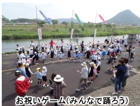
お祝いゲーム(みんなで踊ろう)

河原の清掃やフナの稚魚約1,000匹の放流を行い、豊かな自然と戯れながら地域を潤す土器川の大切さや水難事故の怖さなどを学んでもらい、土器川への関心を深めてもらいました。