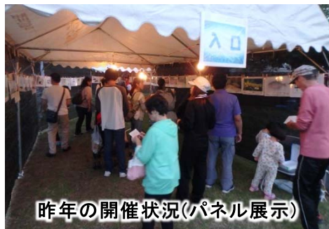
昨年の開催状況(パネル展示)