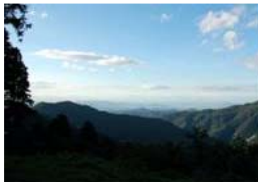
大滝山の山頂からの眺め