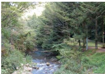
雑木林に囲まれたみずべ

みずべには、キャンプ場が設けられていて、泊まって遊べるようになっています。また、遊歩道が整備されており、自然観察やバードウォッチング、ハイキングなどに最適の場所であり、憩いの森で毎月一回様々なイベントが催されていたりと、キャンプとともに楽しめます。