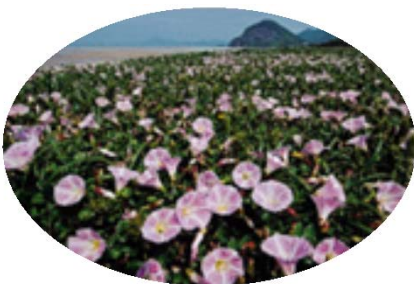
有明浜に咲くハマヒルガオ

有明浜は、2kmに渡って白い砂が美しい広い砂浜海岸で海水浴場として親しまれています。観音寺市の天然記念物に指定されている海浜植物群があり、観察して歩くのも楽しい体験です。背後の松林は琴弾公園として整備されその中には、有名な銭形砂絵があり、春と秋に行われる砂絵の修復は見学可能で、修復に参加することも出来ます。琴弾公園の背後には琴弾山があり、ここの象ヶ鼻銭形展望台から眺める東西122m、南北90m、周囲345mもある巨大な銭形の砂絵は圧巻です。また、砂絵だけでなく、燧灘(ひうちなだ)の絶景も楽しむことが出来ます。