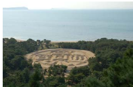
琴弾公園(銭形砂絵)と有明浜