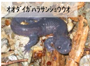
オオダイゴハラサシヨウウオ