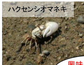
ハクセンシオマネキ