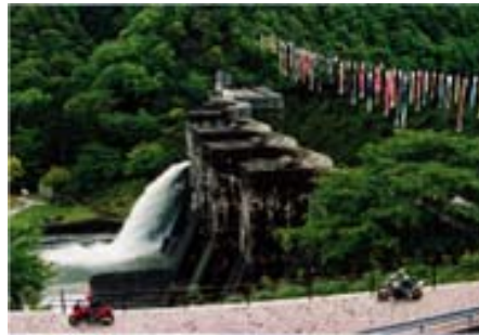
夏季：ゆる抜き(放流)