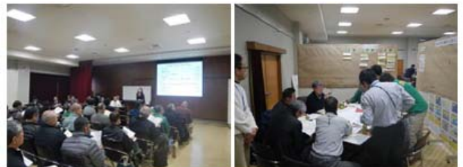
ワークショップの状況

http://www.skr.mlit.go.jp/kagawa/river/daikibosuigai/index.html