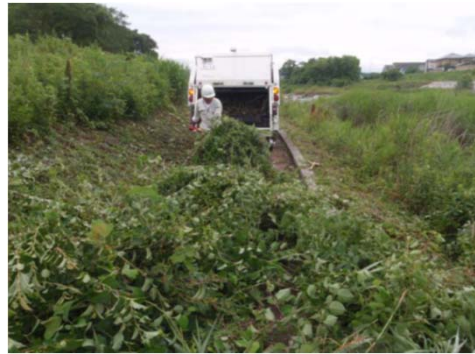
土器川河川敷の草刈り(①)