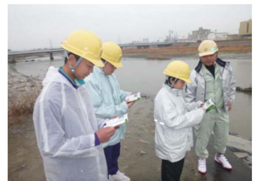
地元中学校への環境体験学習(④)