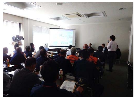
「合同会議」実施状況