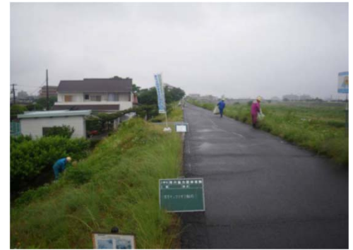
特定外来種(オオキンケイギク)の駆除(①)