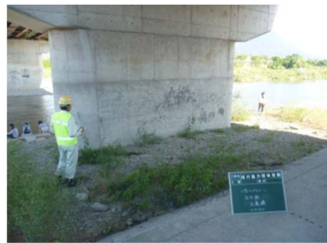
スプレー落書き報告(②)