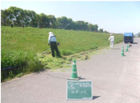
土器川河川敷の草刈り(①)

全国では195団体が河川協力団体として指定されており、土器川においては4団体指定され、以下のような活動を行っております。 ※協力団体の指定数は平成27年4月10日時点(国土交通省 水管理・国土保全局調べ)