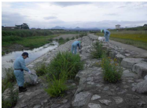
土器川河川敷の清掃(①)