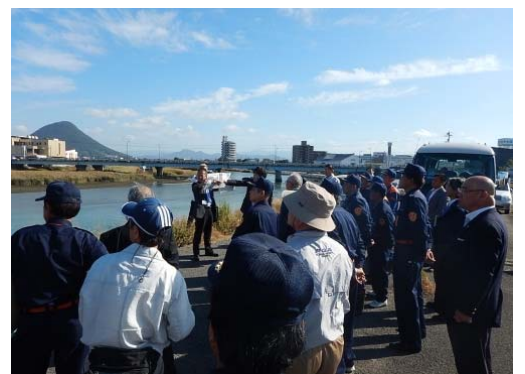
「共同点検」実施状況