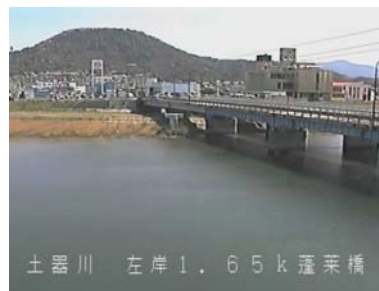
土器川 左岸1.65k 蓬萊橋