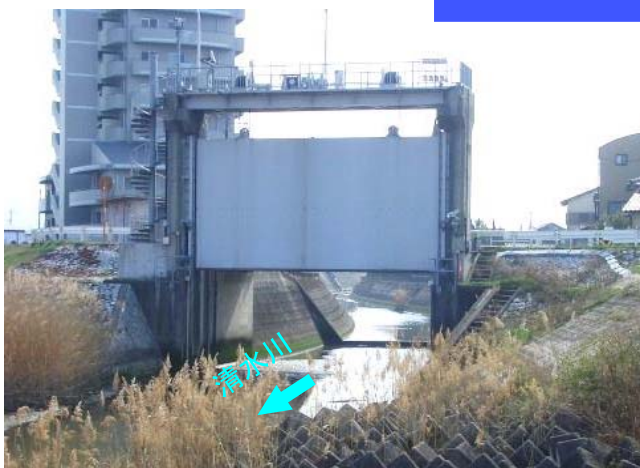
清水川水門(改修前)