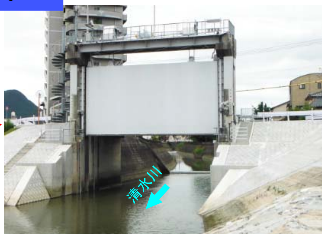
清水川水門(改修後)