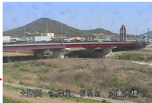
土器川 左岸3.65k 丸亀大橋

カメラアイコン(または地図横にあるリンク)をクリックすると、新規ウィンドウで画像ページが開きます。