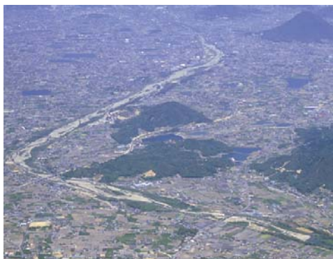
ため池が多く見られる土器川流域