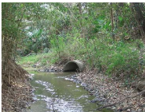
土器川沿いに多く見られる出水