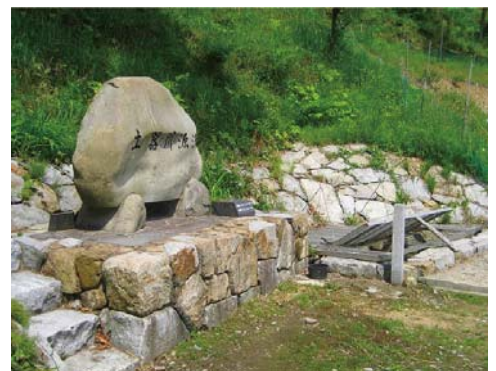
土器川源流(まんのう町勝浦)

土器川リバーキーパーズ通信は、皆様のご意見・ご質問に河川管理者としてお答えしていくものです。土器川に関して、気になっていること、わからないことなど、どしどしとご意見をお寄せください。