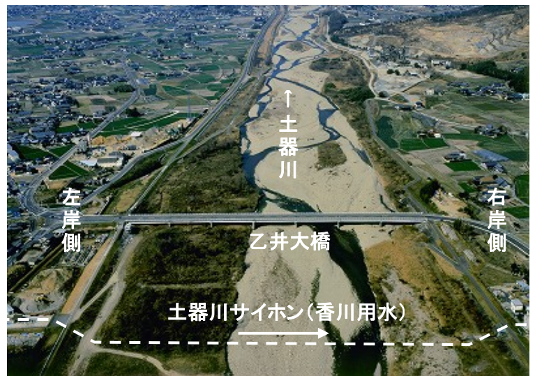
土器川を横断する香川用水