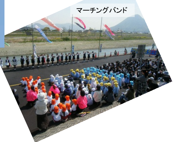
マーチングバンド