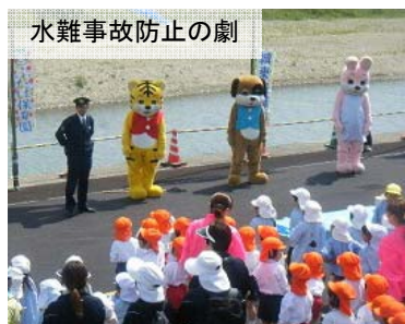
水難事故防止の劇