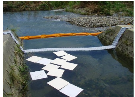
平成22年6月川西地区 吸着マット、簡易シルトフェンス

仮に使用済みの天ぷら油を500mlを川に流すとすれば、魚がすめる水質(BOD:5mg/l以下)にするために、バスタブ(300l)500杯分(150,000l)の水が必要であるといわれています。平常時に流量の少ない土器川においては、特に水質事故の影響を受けやすい川であるといえるでしょう。