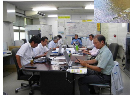
H22年 総合防災訓練 実施状況