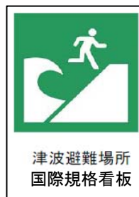
津波避難場所 国際規格看板