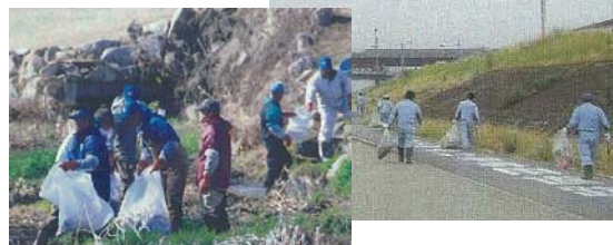
香の川パートナーシップ活動状況