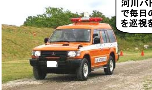
河川パトロールカー