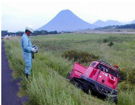
草刈車(遠隔操縦式)