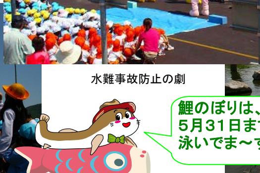
水難事故防止の劇