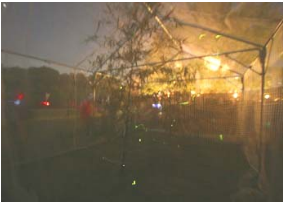
ホタルの鑑賞状況