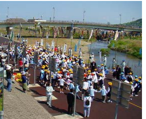
フォークダンスをする園児達