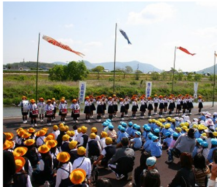
演奏をする小学生達

去る4月27日(月)、丸亀市土器町西の城東小学校前の土器川の河川敷「みんなの広場」において、今年で10回目となる「土器川・You・遊フェスター泳げ鯉のぼりー」が開かれました。丸亀市城東小学校区の小学校、幼稚園、保育所の児童、園児が246人が参加し、子供達で作ったこいのぼり約340匹が泳ぐ中、フォークダンスや玉入れをして楽しみました。また、河原の清掃や淡水魚の放流に取り組み、豊かな自然と戯れながら地域を潤す川の大切さを学び、丸亀警察署や丸亀市役所が披露した水難事故防止を訴える劇から河川の安全利用について学びました。