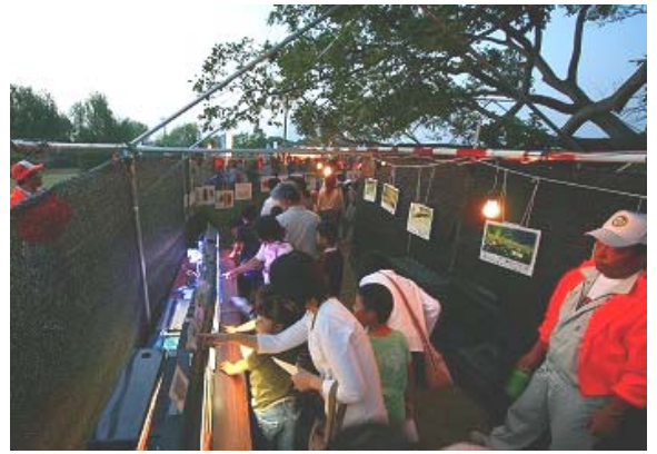
ホタルの一生探検見学