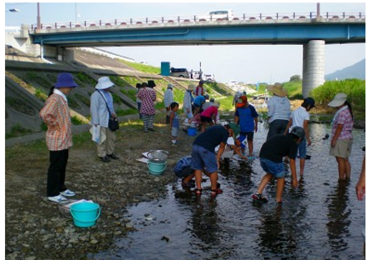
水生生物調査(高速道路橋地点)