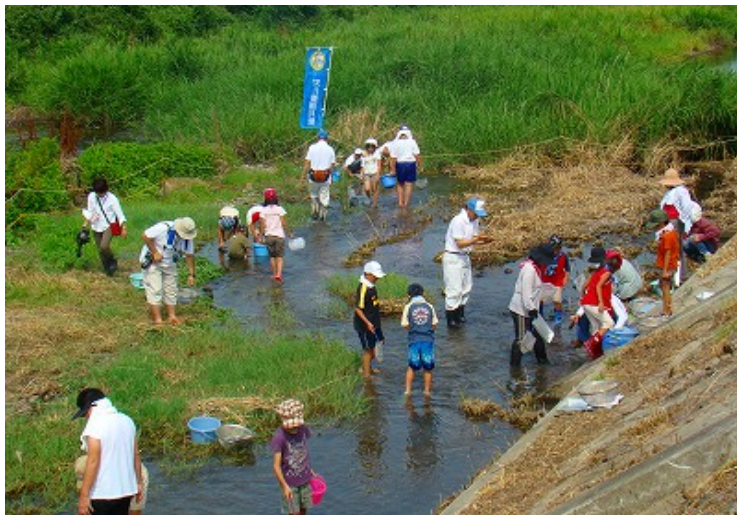
水生生物調査(丸亀大橋地点)