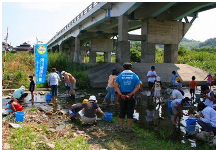
水生生物調査(祓川橋地点)