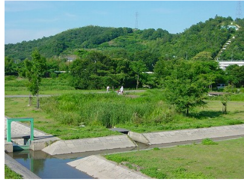
⑤ウォーターパーク