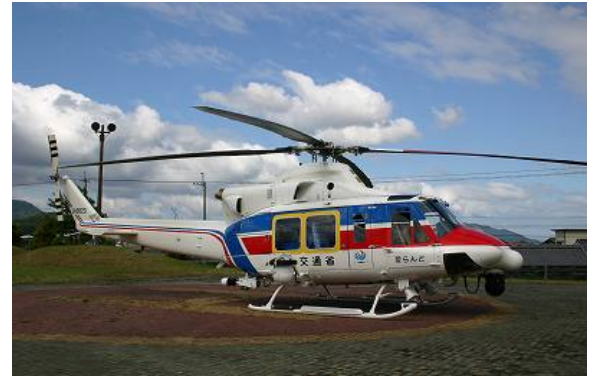
災害対策用ヘリコプター

災害が発生したときは、地域で協力していくことが大切です。この日の経験を生かし、みんなで防災の意識をたかめていきましょう。