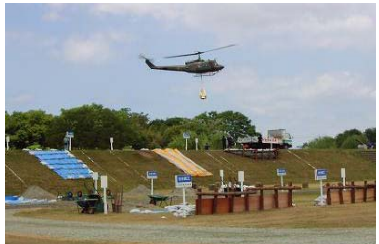
ヘリコプター緊急物資輸送訓練