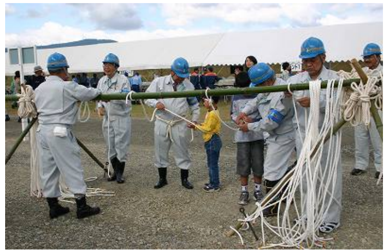
ロープワークの講習