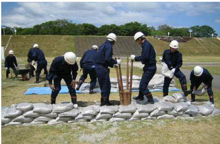
水防工法(積み土のう工)の演習