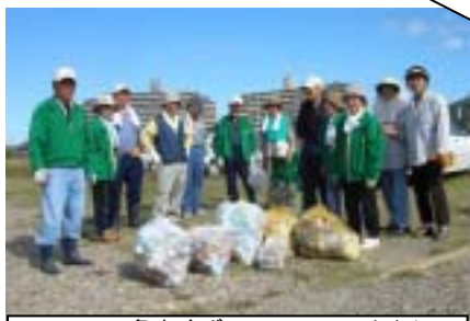
NTT・OB亀友会ボランティアのみなさん