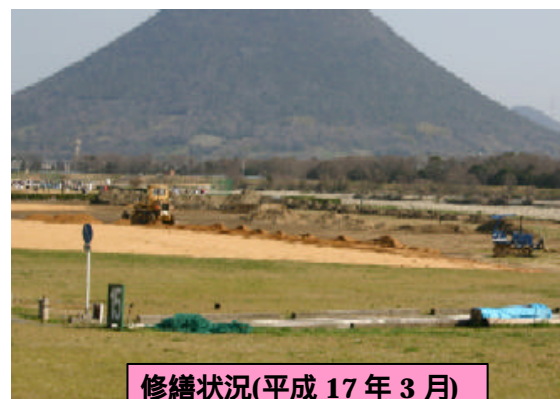
修繕状況(平成17年3月)