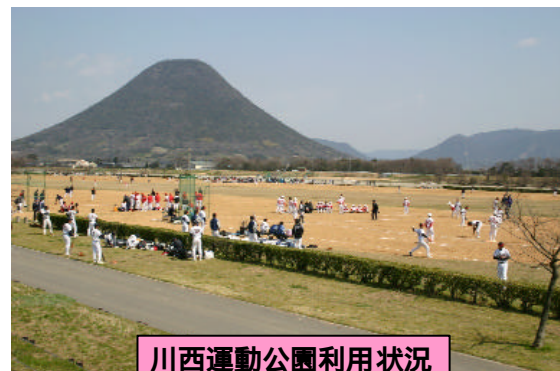
川西運動公園利用状況

また、河原の樹木などに引っ掛かったわらや草本は水質に影響を及ぼしたり河川管理上支障とならないため除去する予定はありませんが、河川内の一般ゴミや粗大ゴミは、河川管理に問題（水質汚染等）となる場合があるため撤去していきます。