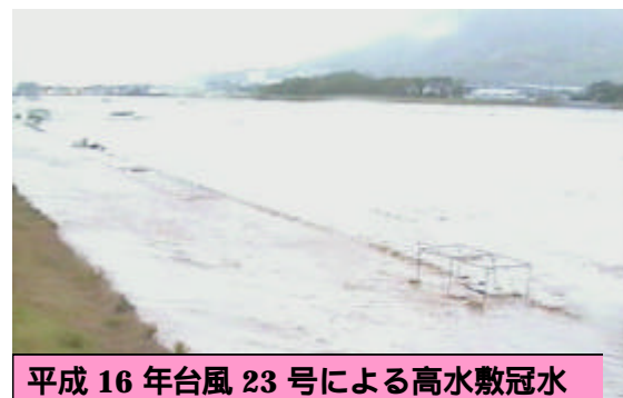
平成16年台風23号による高水敷冠水