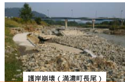
護岸崩壊(満濃町長尾)