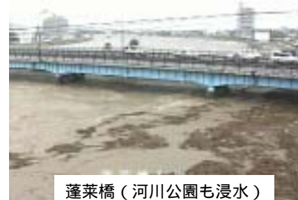
蓬萊橋(河川公園も浸水)

土器川流域市町である丸亀市、飯山町、綾歌町、満濃町では全体で床上浸水294戸、床下浸水1479戸(香川県総務部危機管理課12月9日発表)等大きな被害が出ています。特に土器川周辺では丸亀市の土器町、土居町で家屋浸水が発生する被害がありました。また、上流の満濃町長尾地区では護岸が崩壊するなど、各所で護岸等が洗掘による被害を受けています。