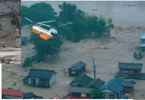
刈谷田川堤防決壊(新潟県)H16.7