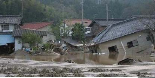
出石川堤防決壊(兵庫県)H16.10