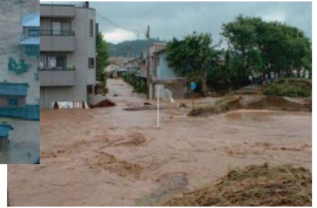
足羽川堤防決壊(福井県)H16.7

「水害に強いまちづくり」「地域の生き残り」のために、 特に必要な対策は？ 優先的に対応すべき対策は？