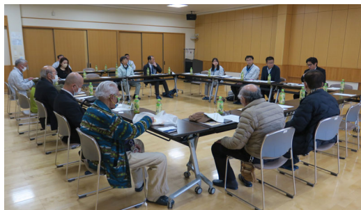
河川愛護モ二夕一会議