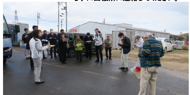
会議後に土器川で打合せ