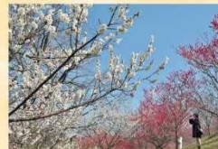
ウメ 2月上旬～3月上旬