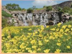
キバナコスモス 9月上旬～ 10月上旬

コキアの柔らかな緑葉は、秋の深まりとともに色に変化し、10月中旬には真っ赤に染まります。秋を代表する花、コスモスも人気です。期間中は、スポーツ・アウトドア・芸術などの各種イベントを開催します。