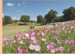
コスモス 9月中旬～ 10月下旬