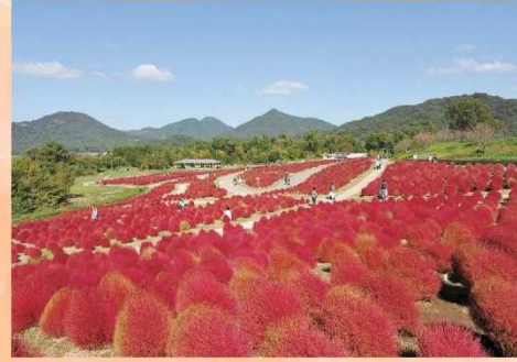
コキア 緑から赤へのグラデーション→真紅→赤から小麦色へのグラデーション (9月下旬～10月上旬) (10月中旬) (10月下旬)