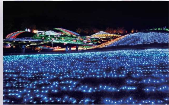
グランドイルミネーション イルミネーション装飾の色合いやデザインはその年のテーマによって異なります。