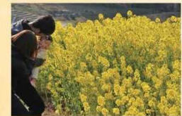
ナノハナ 2月中旬～3月下旬