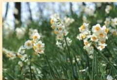
ニホンズイセン 2月上旬～2月下旬

冬と春の間、風の冷たさと日差しのおぬもりを感じる季節。ニホンズイセン、ウメ、ナノハナなど、園内各所で早春の花々が開花し、色の少ない風景に少しずつ彩りが増えています。木漏れ日の中を散策しながら、小さな春を見つけてください。