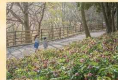
クリスマスローズ 2月上旬～3月下旬