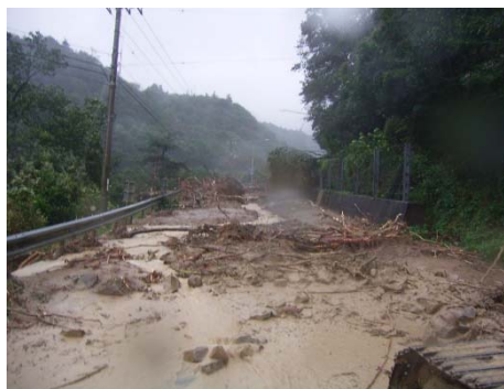
〈平成16年10月20日台風23号による斜面崩壊〉