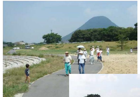
飯山 DOKI! 土器パーク