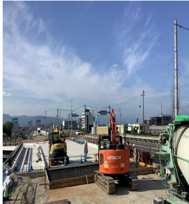
踏掛版（橋梁と地面の段差の発生を予防するもの）を設置しています。