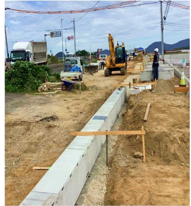
排水構造物（雨水・排水を流すためのもの）を設置しています。