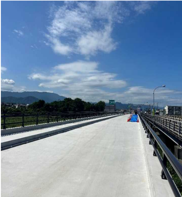
本山橋新橋の高欄（柵）の設置が完了しました。