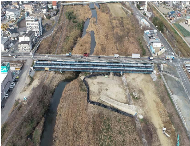
本山橋の桁が架かりました。