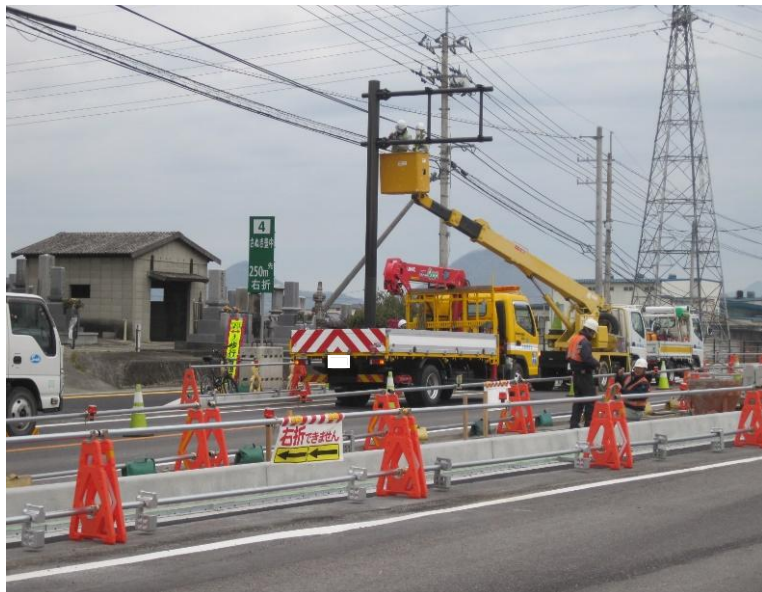
上高野地区の安全施設工事を実施しています。