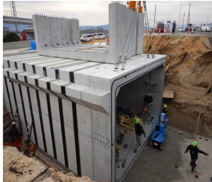
本山甲地区の改良工事を実施しております。