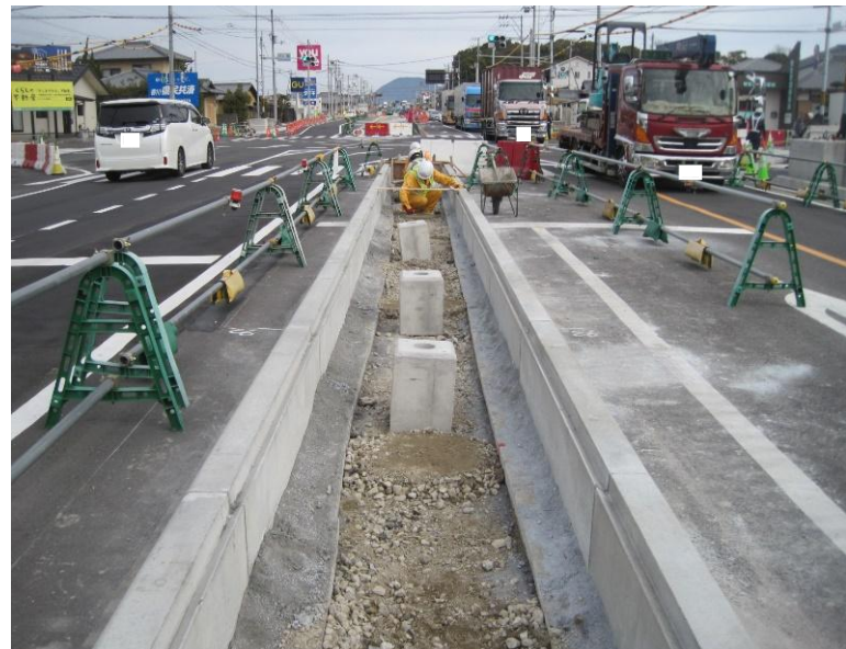
本山甲地区の中央分離帯の施工を実施しています。