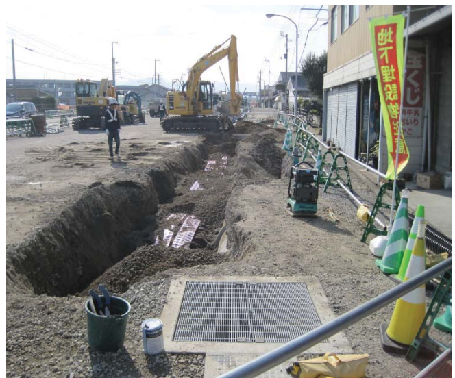
本山甲地区の電線共同溝工事を実施しています。