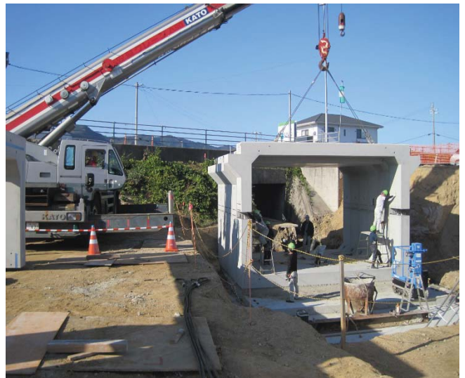
本山甲地区の道路改良工事を実施しております。