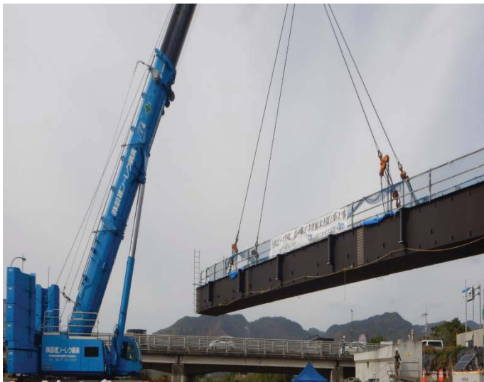
本山橋の桁を架け始めました。