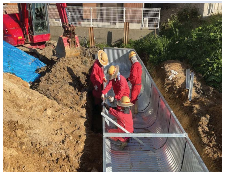
本山甲地区の改良工事を実施しております。