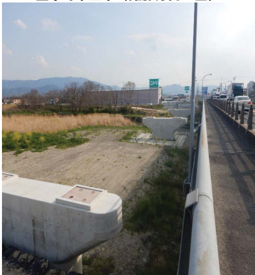
本山橋の下部が完成しました。