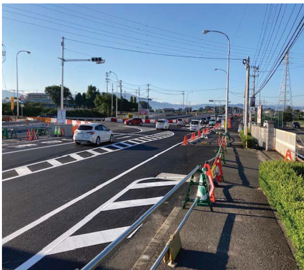
上高野地区の車線切替が完了しました。