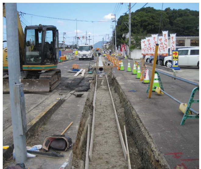
本山甲地区の排水構造物工事を実施しています。