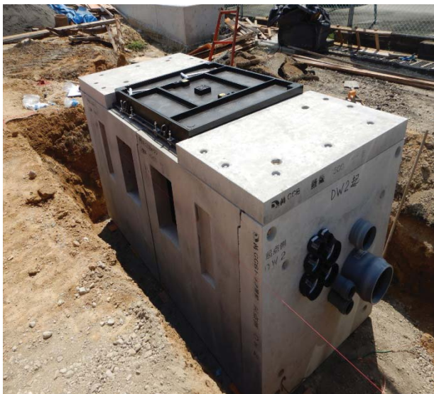
上高野地区の電線共同溝工事を行っています。