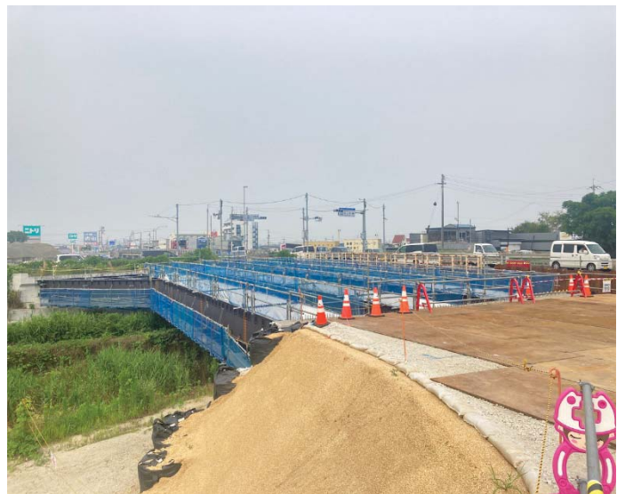
本山小橋上部の桁架設が完了しました。