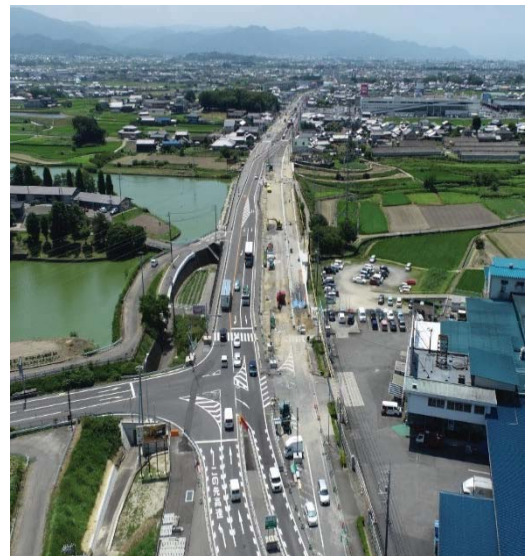
令和4年8月撮影（車線切替中）