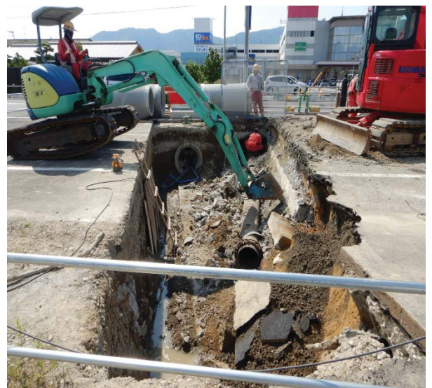
本山甲地区の改良工事を施工しています。