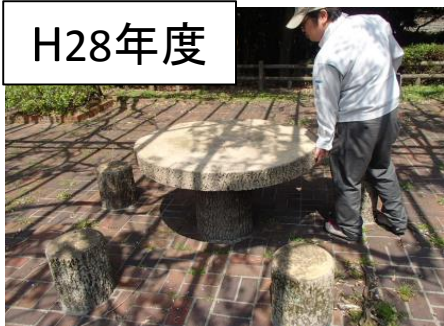
野村ダム右岸公園 テーブルの不具合(ぐらつき有り)