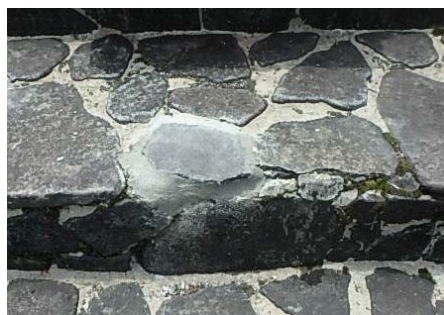
モルタルにより補修