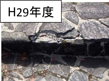
野村ダム左岸公園 階段の欠損