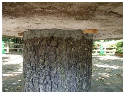
テーブルの固定を行い対応