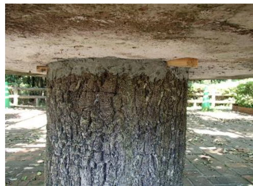
テーブルの固定を行い対応