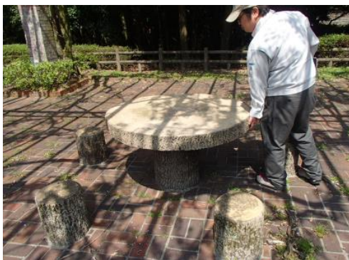
野村ダム右岸公園 テーブルの不具合(ぐらつき有り)