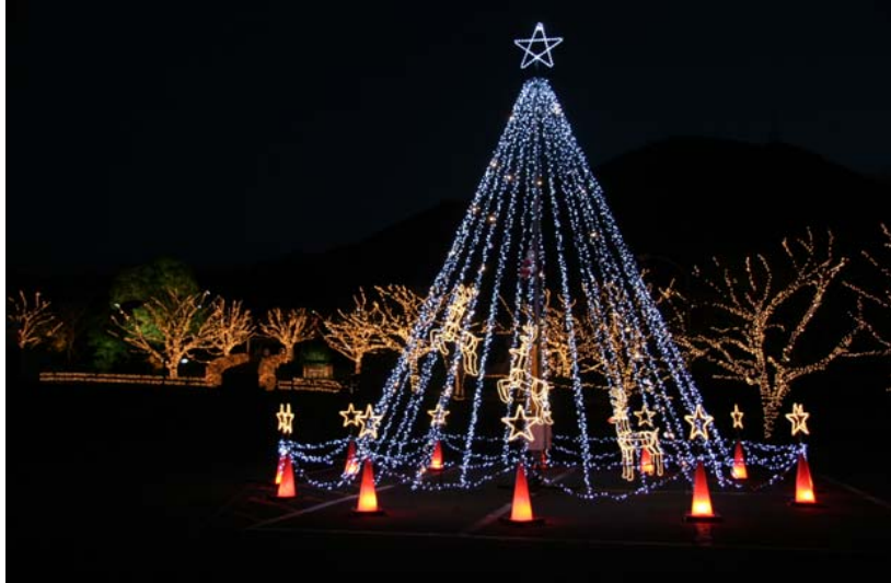
クリスマスツリー型イルミネーション