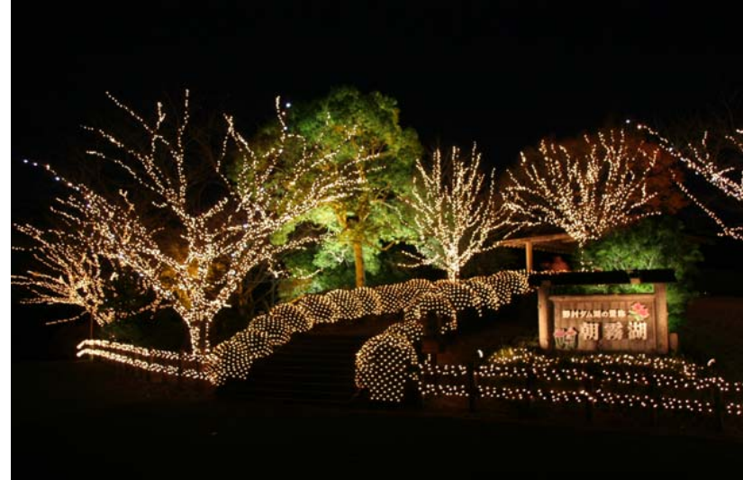
ツリーイルミネーション・ネットイルミネーション・スポット照明