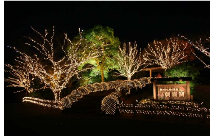
ツリーイルミネーション・ネットイルミネーション・スポット照明