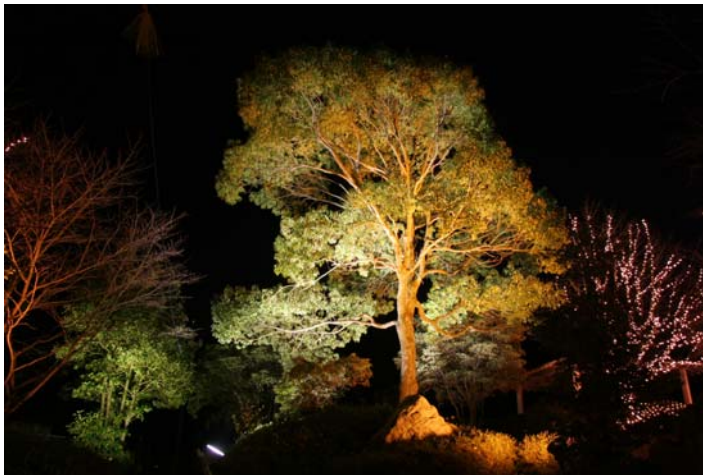
立木ライトアップ