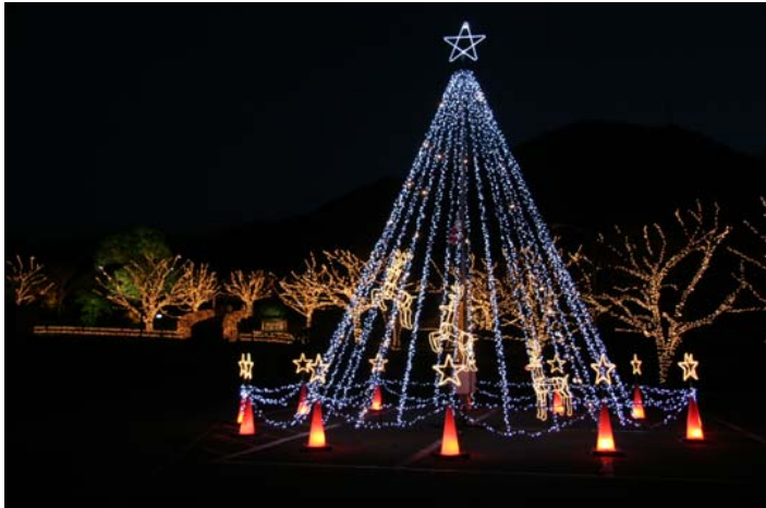
クリスマスツリー型イルミネーション