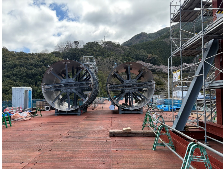
天端仮設構台（吊込み準備）