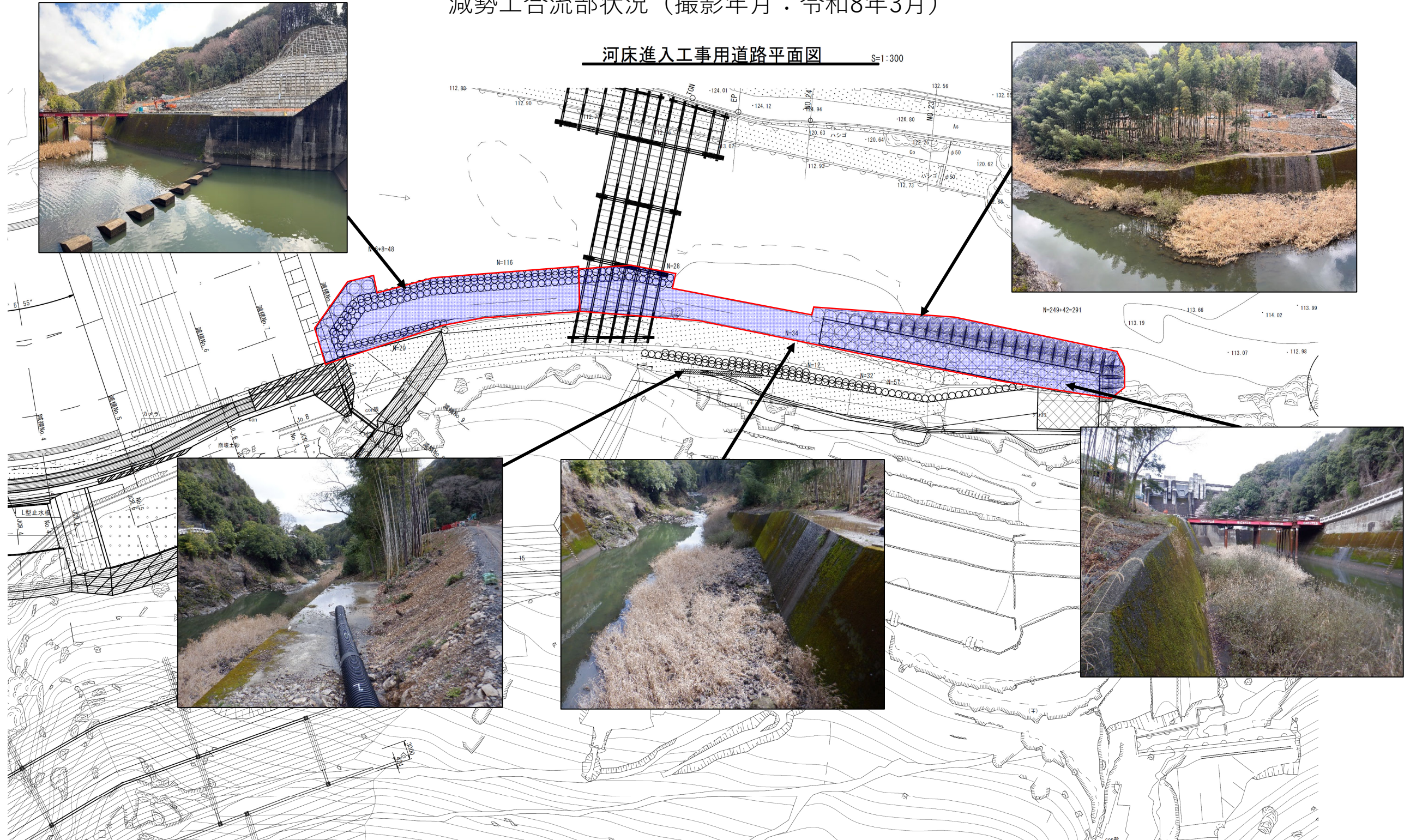
河床進入工事用道路平面図 S=1:300