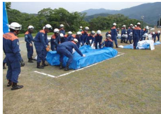
積み土のう工（改良型）