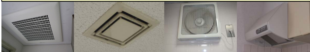
便所、湯沸かし、居室等の換気扇

人事院規則(事務所衛生基準規則第9条)の規定により、国の職員が勤務する建築物の換気について「 機械による換気のための設備 」の 点検 を行う事が義務付けられています。