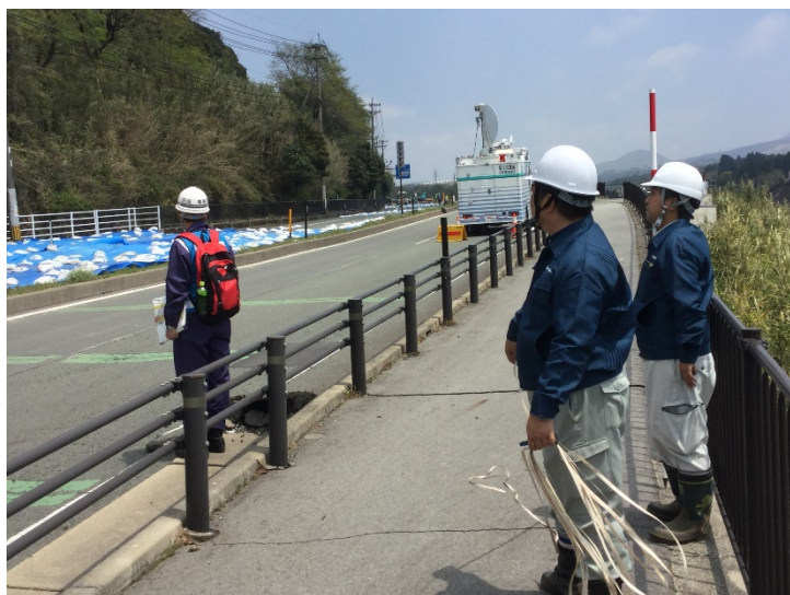
取付け位置の確認