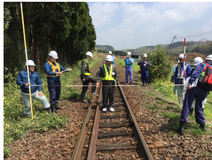
予定用地の調査状況