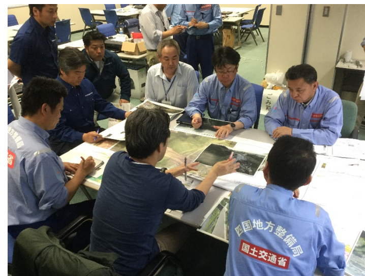
熊本河川国道事務所に説明